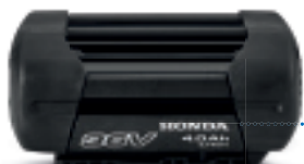
36V 4,0 Ah DP3640XA