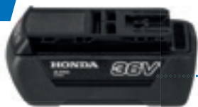
36V 2,0 Ah DP3620XA E