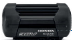
36V 6,0 Ah DP3660XA